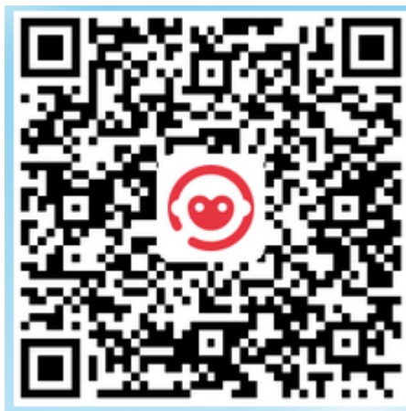
学员版下载二维码